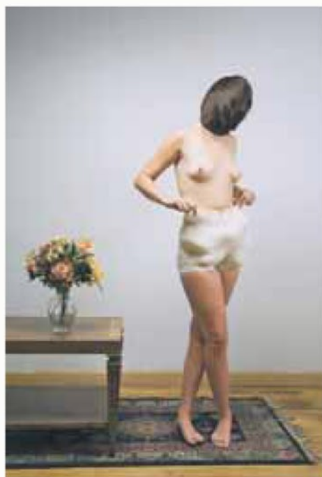
Alison Brady | Untitled AB-1027 | 2008 | © Alison Brady

Der Körper selbst ist die Maske, gleich ob er sich anonymisiert und zur Dekorform verfremdet in ein Rätselobjekt