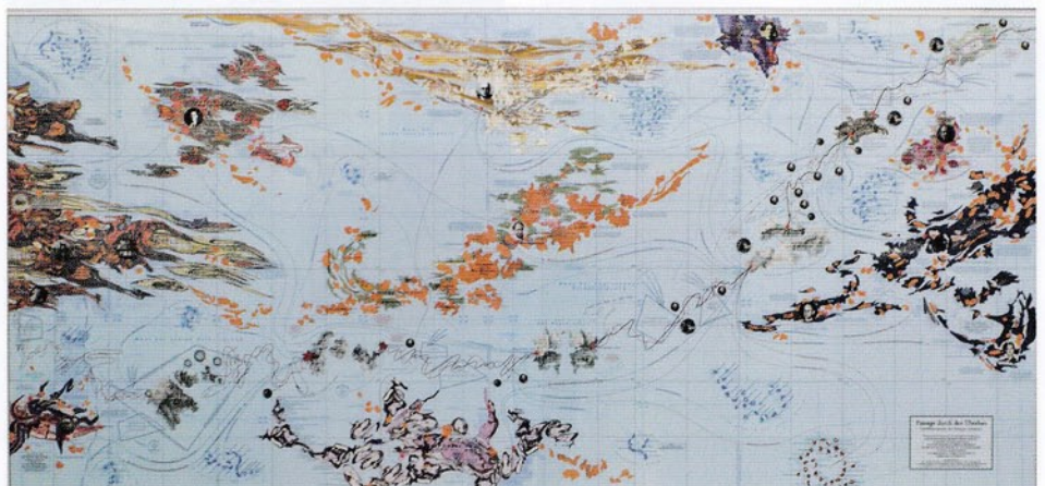
Stephan Huber: Passage durch den Überbau - Schifffahrtskarte für bewegte Gewässer

„Stephan Huber Weltatlas“ ist bis 28. März in der ERES-Stiftung, Römerstraße 15, samstags 11-17 Uhr und nach tel.Vereinbarung (089-388 79 0 79) zu besuchen.