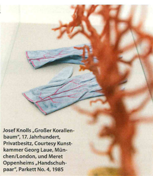
Josef Knolls „Großer Korallenbaum“, 17. Jahrhundert, Privatbesitz, Courtesy Kunstammer Georg Laue, München/London, und Meret Oppenheims „Handschuhpaar“, Parkett No. 4, 1985