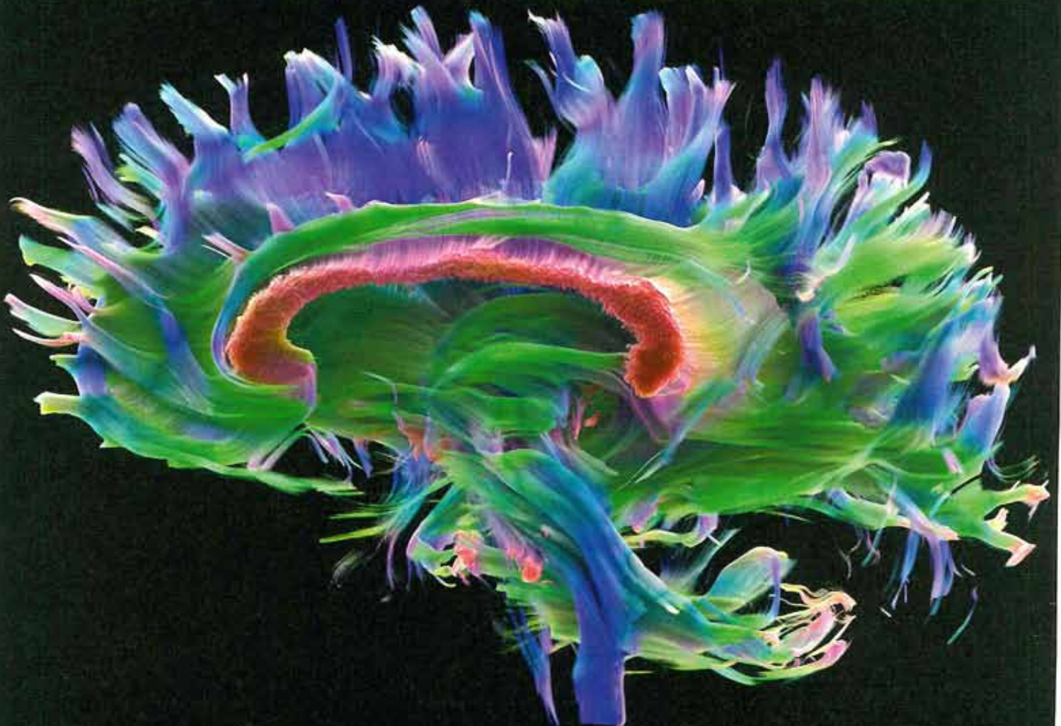
Cinematic-Rendering-Darstellung der Nervenfasern im Gehirn auf Basis von Magnetresonanzdaten

Kein Bereich der Medizin hat so viele Kontaktstellen zur Kunst wie die Anatomie. Nicht nur Ärzte benötigten spätestens seit der Renaissance zum Studium und zur Berufsausübung anatomisch korrekte Darstellungen des menschlichen Körpers, auch im Kanon der Künftlerausbildung wurde ein intensives Studium der Anatomie Voraussetzung, zum Begreifen eines der wichtigsten Motive der Kunst, des Menschen.