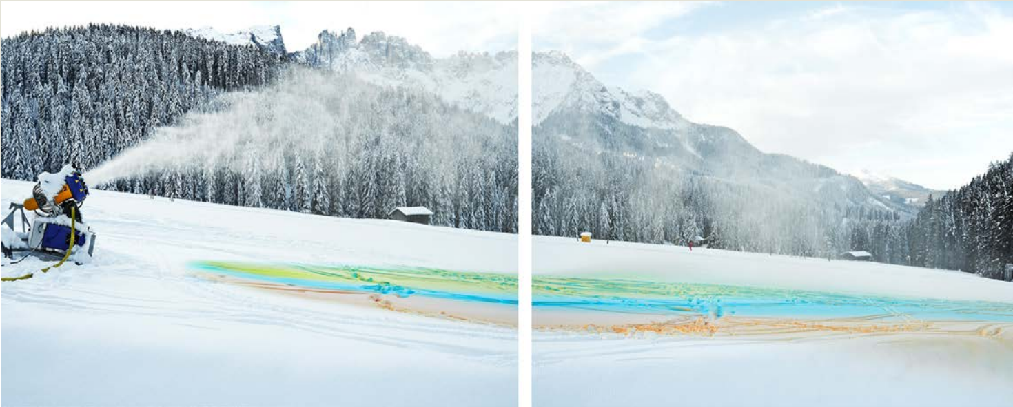
Philipp Messner, Walter Niedermayr: „Kunstschnee 09“, 2014, Ink-Jet-Print auf Papier, jeweils 132 x 104 cm