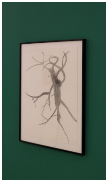
Albert Oehlen: Untitled, 1990; Bleistift auf Papier, 60 x 45,5 cm