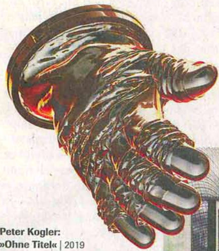
Peter Kogler: »Ohne Titel« | 2019 Digitaldruck | © the artist Foto: Thomas Dashuber

Die ERES-Stiftung widmet sich der Mondraumfahrt: ihrer Technologie wie der künstlerischen Reflexion und der »Space«-Ästhetik der zeitgenössischen Kultur.