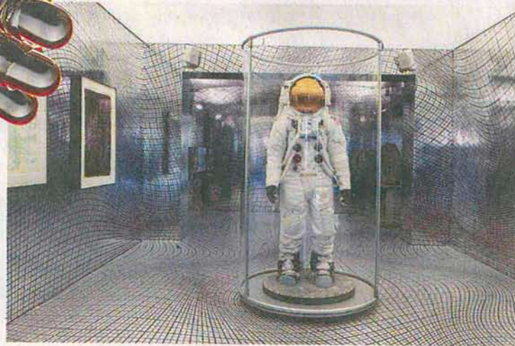
Ausstellungsansicht »ZERO GRAVITY« | Rauminstallation von Peter Kogler: »Ohne Titel« | 2019 | Digitaldruck auf Spiegelfolie | © the artist