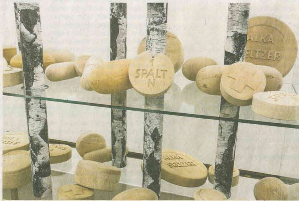
Martin Kippenberger, Jetzt geh ich in den Birkenwald, denn meine Pillen wirken bald, 1993

Durch ein zweites Fenster im beklebenden Hüttchen sieht man die wunderbare Videoarbeit „Der rechte Weg“ von dem Schweizer Künstlerduo Fischli/Weiss. 1983, als das Waldsterben großes Thema war, verkleideten sich die beiden als Bär respektive Ratte und stolchten quatschend, staunend, philosophisch angehaucht im Wald umher, genossen die Natur und sonstige Weltwunder jenseits toxischer, vor allem aber blockierender Allerweltsszenarien. Der drohenden Katastrophe, gleich welcher Art, trotzten die beiden stets mit Anarchie, am besten in der Extremgestalt des Banalen.