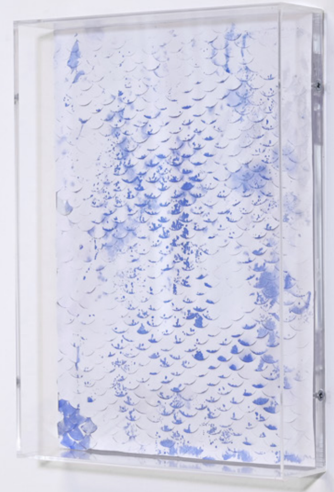
Ausstellungsansicht: Shifting Waters , ERES Stiftung, Pamela Rosenkranz, Foto: ERES Stiftung, Lukas Kindermann

Diese Verbindung bleibt nicht auf Venedig beschränkt. Die Ausstellung ist Teil eines größeren Programms: Bereits während der Biennale wird ein Teil der gezeigten Arbeiten nach München überführt, wo sie in einem erweiterten Kontext neu verhandelt werden. Perspektivisch mündet dies in eine umfassende Ausstellung zum Thema Wasser, die den wissenschaftlich-künstlerischen Dialog in größerem Maßstab 2027 fortführt. Venedig wird damit zum Auftakt.