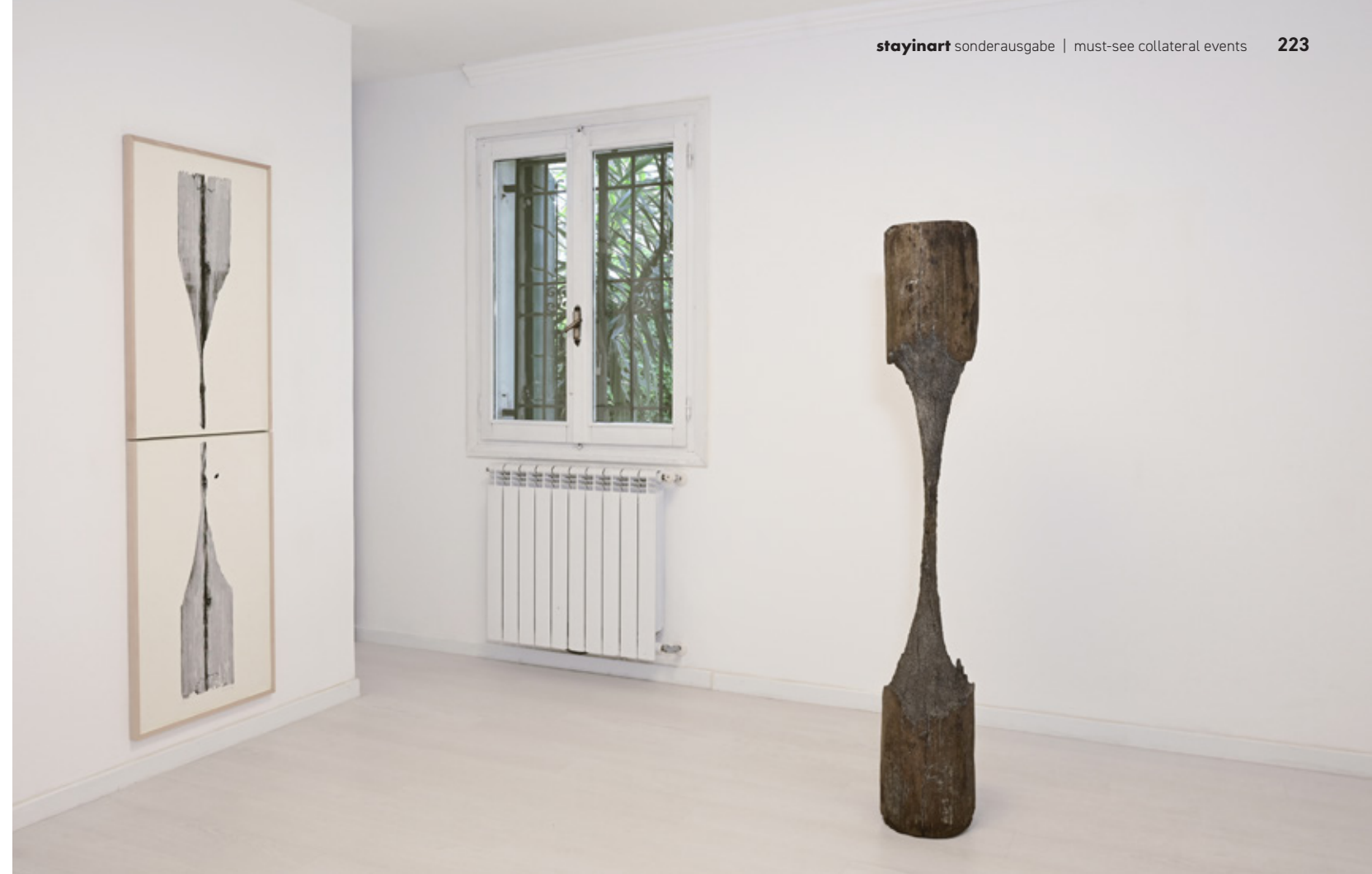
Ausstellungsansicht: Shifting Waters , ERES Stiftung, Giorgio Andreotta Calò

Mit Giorgio Andreotta Calò richtet sich der Blick auf die verborgenen Strukturen der Stadt. Seine Auseinandersetzung mit den sogenannten »Briccole«, jenen Holzpfählen, die die Wasserwege markieren, lenkt die