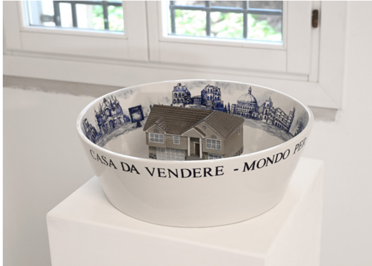
Ausstellungsansicht: Shifting Waters , ERES Stiftung, Mike Bouchet, Foto: ERES Stiftung, Lukas Kindermann

Blick: »Was hat sich seitdem eigentlich geändert?«, hinterfragt Sabine Adler. Die Antwort bleibt bewusst offen und verweist auf eine Diskrepanz zwischen Wissen und Handeln, die sich durch viele der gezeigten Positionen zieht.