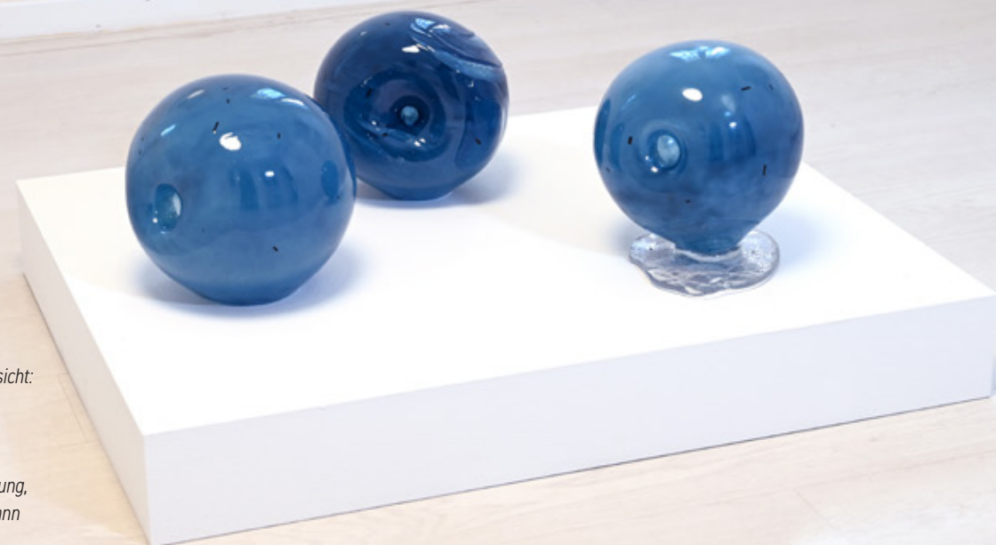
Ausstellungsansicht: Shifting Waters , ERES Stiftung, Sonia Leimer, Foto: ERES Stiftung, Lukas Kindermann